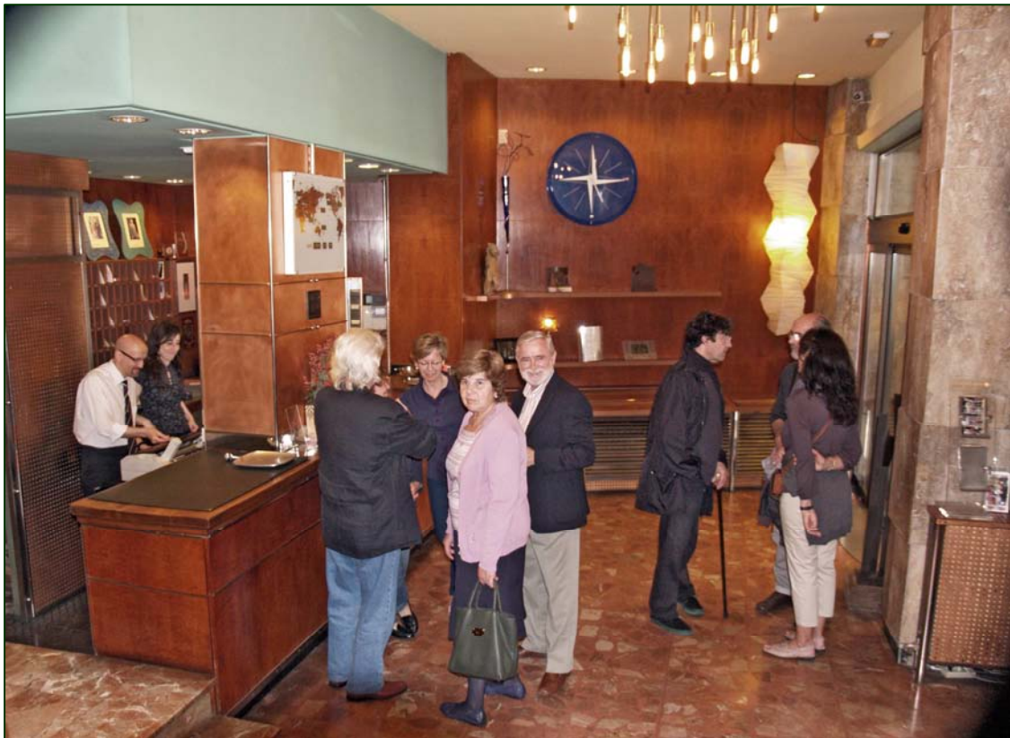
Los primeros madrugadores en el hall del Hotel entre abrazos y recuerdos.

Los “adelantados” estaban citados en el Hall del Hotel a las 21 horas del viernes 27, algo que fueron llegando con cuentagotas debido a importantes e imprevistos problemas de tráfico en la eterna salida de Madrid: