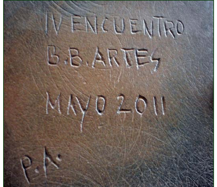
Anverso y reverso del Modelo cocido a 950 ° C y patinado en frío