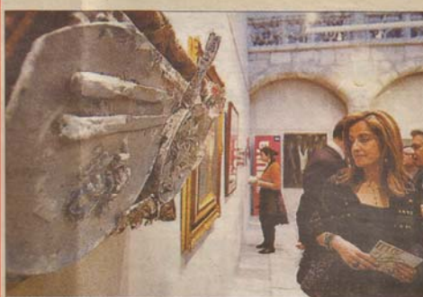
La exposición recoge esculturas, cuadros y fotografías.