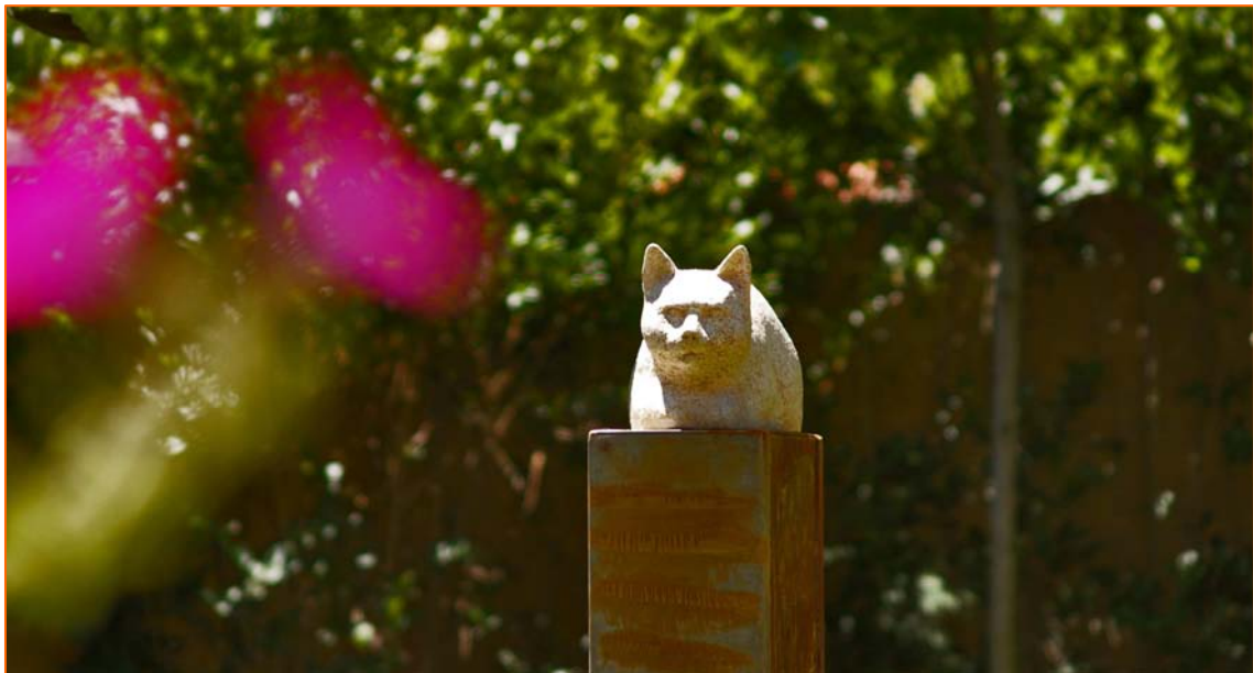
Integrado totalmente dentro de lo tanto tiempo fue su entorno de vivencias y correrías, su semblante sereno continúa ahora tranquilo, observador y pendiente siempre de quienes tanto le cuidamos y quisimos

Mi idea era que su imagen estuviese siempre presente y un buen amigo me confeccionó un plinto en chapa de hierro que antes yo le había diseñado, para que finalmente ocupase un lugar destacado en mi jardín particular.