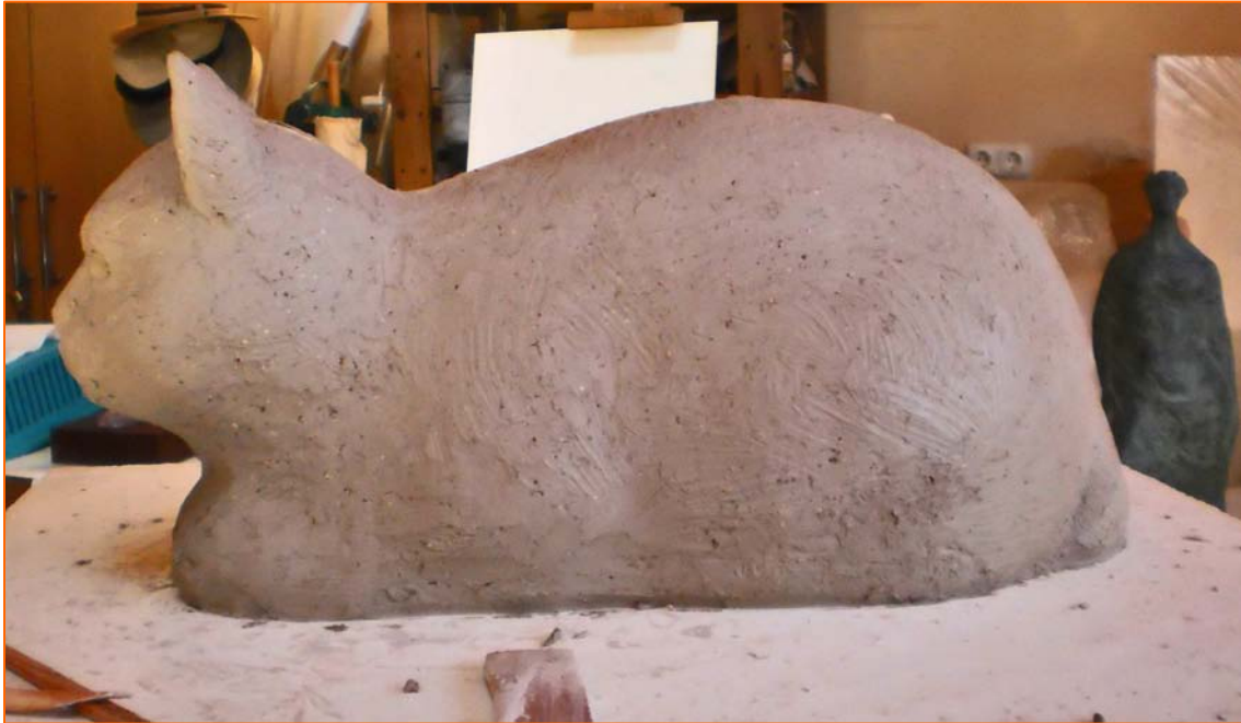
Fase de compromiso escultórico donde las pasiones internas son superadas por el oficio

Luego llegó el compromiso escultórico y las formas fueron tomando su adecuado lugar dentro del conjunto deseado, llegando poco a poco a conseguir el resultado propuesto de perpetuar física y espiritualmente ese ser que durante diecisiete años fue un incondicional a mi lado, dándome todo por nada hasta el final de sus días.