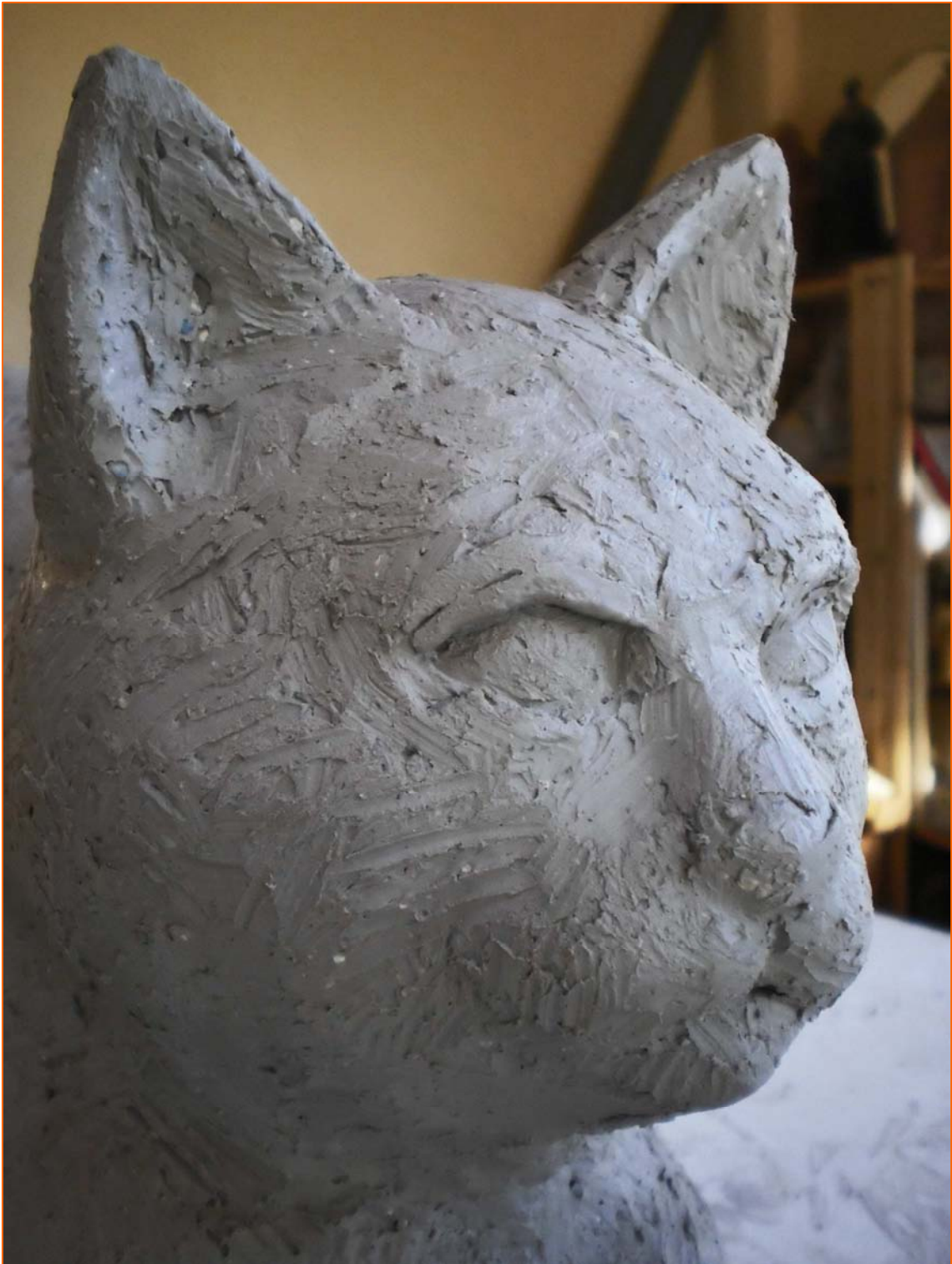
Primer plano de la cabeza aún inconclusa del difícil compromiso escultórico

No recuerdo cuando di por concluida la escultura... fueron momentos difíciles donde el estado anímico negativo afloraba cuando me enfrentaba a la pieza llorando su ausencia. Solo se que después de proceso de cochura, aún ha estado serenamente descansando encima del caballete de escultor otra larga temporada.