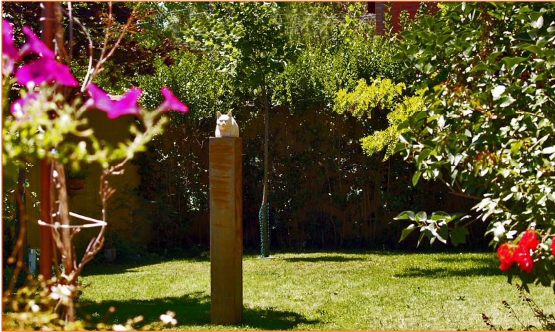
La imagen de Pitín, ocupa desde el 1 de julio un lugar preferente dentro del entorno de mi jardín