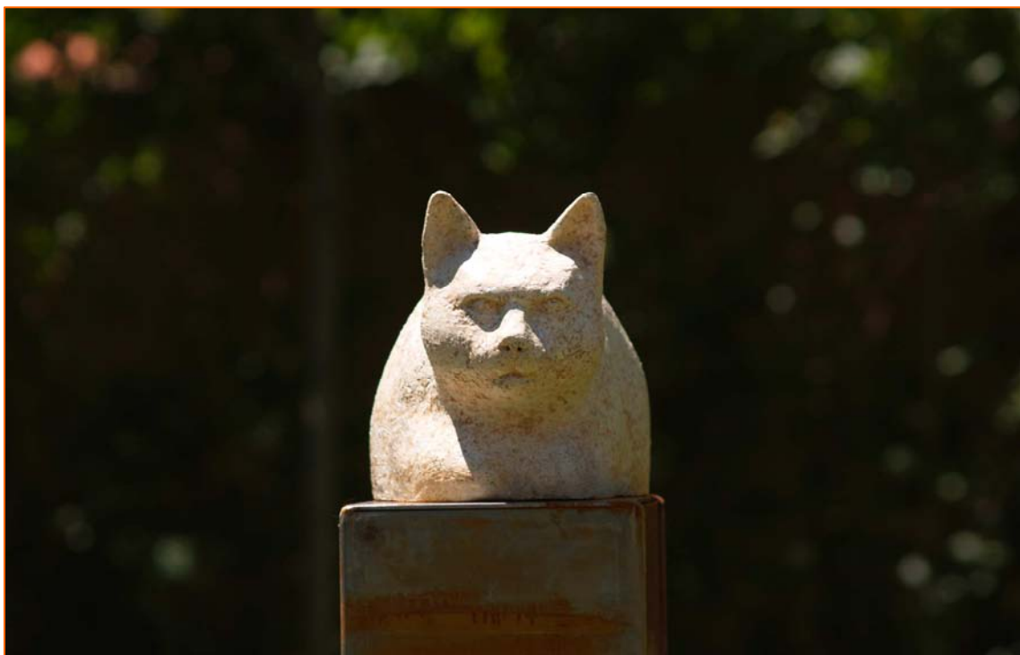
Dos impactantes imágenes de la escultura donde contrasta la calidad pétrea de la obra con la incipiente oxidación natural ferruginosa del plinto.