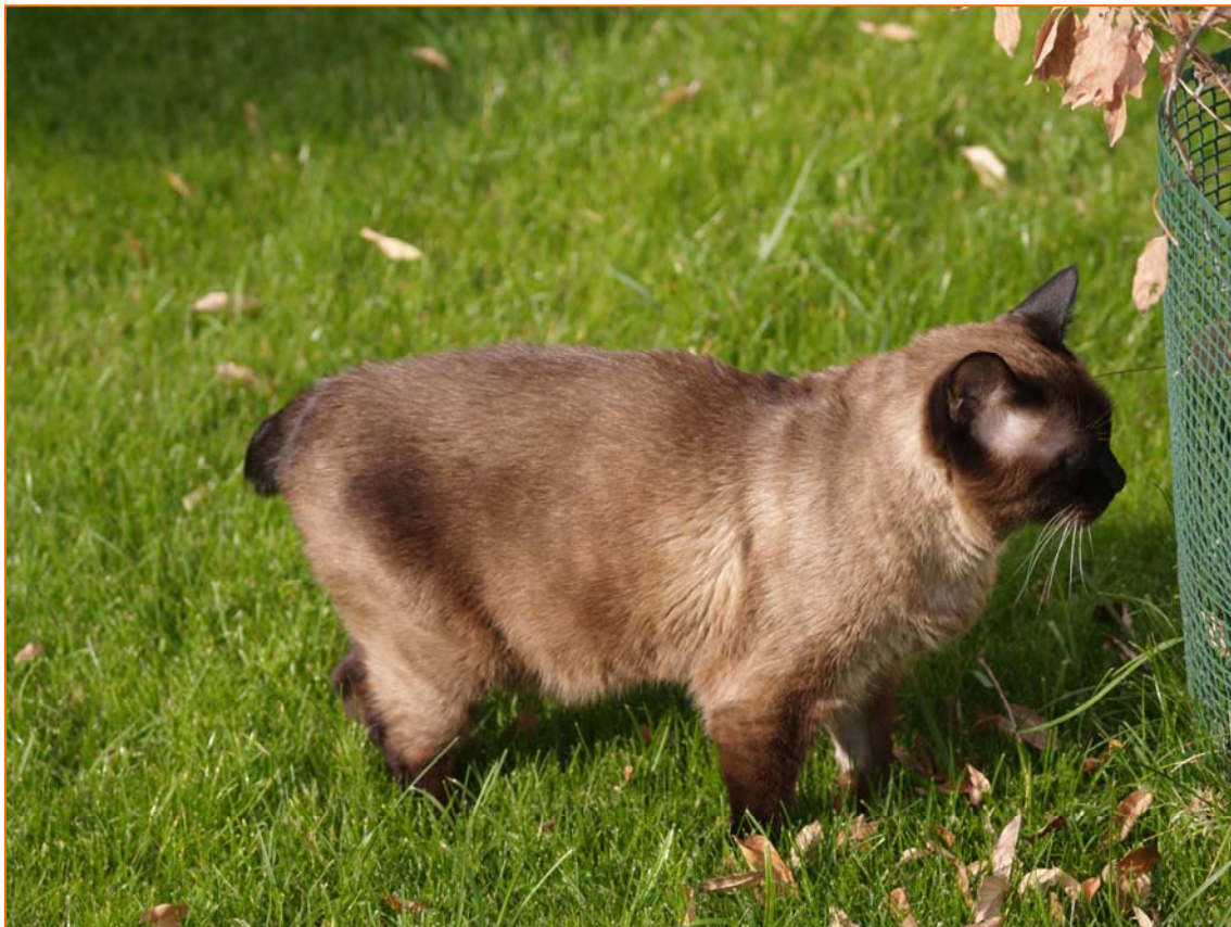
Rabicorto, de tamaño mediano y extremadamente tranquilo, era el semblante y carácter de Pitín

Luego llegó el compromiso escultórico y las formas fueron tomando su adecuado lugar dentro del conjunto deseado, llegando poco a poco a conseguir el resultado propuesto de perpetuar física y espiritualmente ese ser que durante diecisiete años fue un incondicional a mi lado, dándome todo por nada hasta el final de sus días.