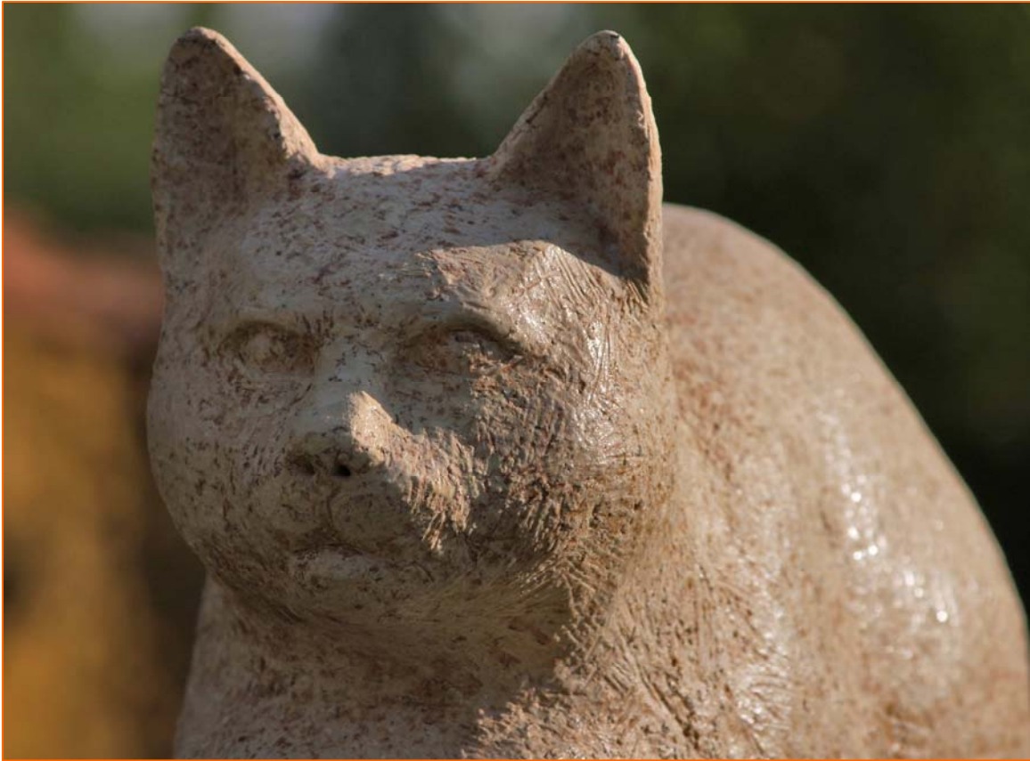
La calidad textural de la pieza está trabajada de forma pétreo