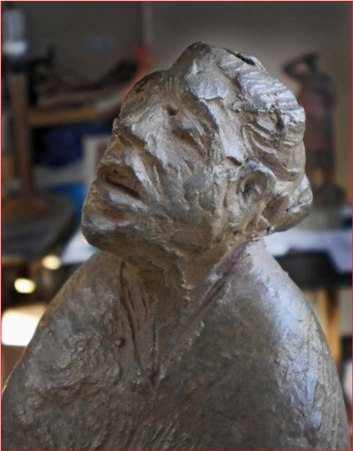
“Madre de la guerra”. Detalle 3