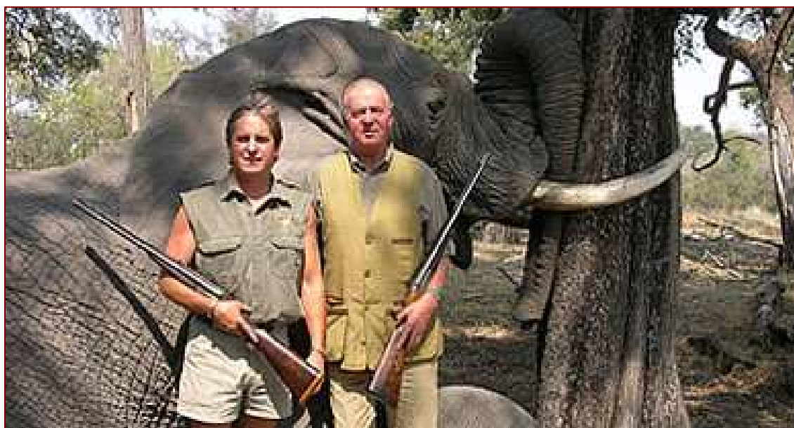
Imagen bochornosa publicada como primicia en la Web de una famosa cadena radiofónica española, el día 14 de abril, y donde aparece nuestro monarca, rifle en mano, delante del cadáver de un elefante.

La “bomba” informativa corre como la pólvora y se difunde no solo por todos los medios, sino que invade las llamadas redes sociales y se levanta una mayoritaria indignación de la plebe. Las banderas republicanas aparecen con mayor clamor y solo los más conservadores, intentan, en vano, “justificar” la impopular cacería de paquidermos por parte de nuestro, hasta ahora, popular y amantísimo monarca. Más tarde, se especularon con miles de posturas a favor y en contra de tan bochornoso suceso, salpicando incluso en muchas declaraciones de las altas esferas gubernamentales y politiqueras...finalmente nuestro Rey, al salir de centro hospitalario donde fue intervenido, pidió públicamente disculpas, aunque la duda que quedaba era saber