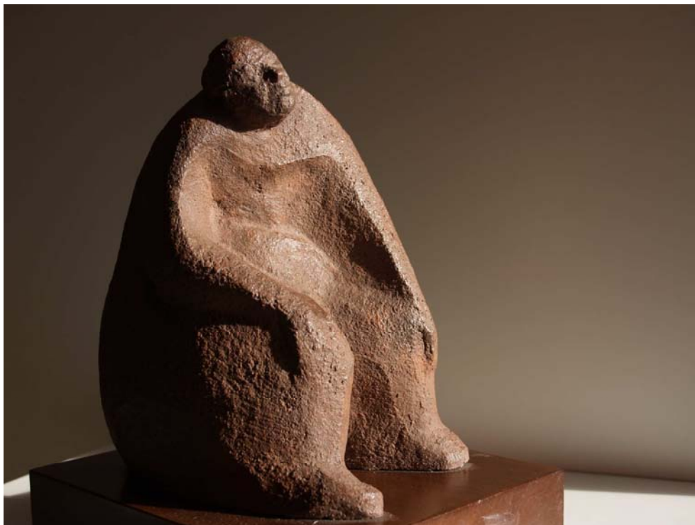
“Padre Omnipotente” fue la pieza escultórica original que doné para la citada muestra benéfica

Cuarenta artistas plásticos colaboramos desinteresadamente en este aniversario de diciembre de 2012