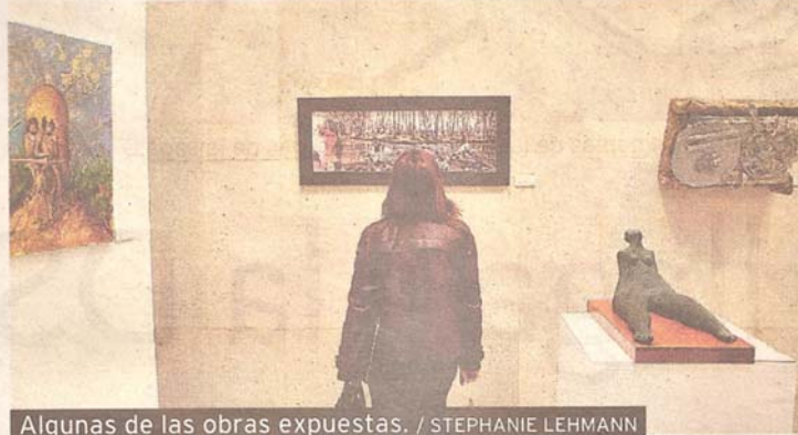
Algunas de las obras expuestas.