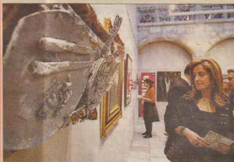
La exposición recoge esculturas, cuadros y fotografías.