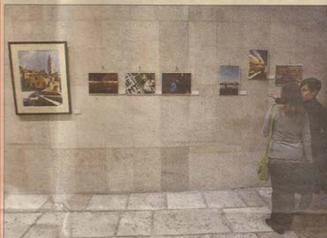
La muestra está compuesta por un total de 24 creaciones, siete de la UVa.