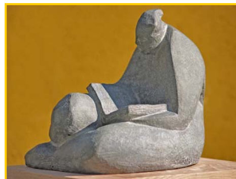
Obra "La Lectura" de Jesús Trapote